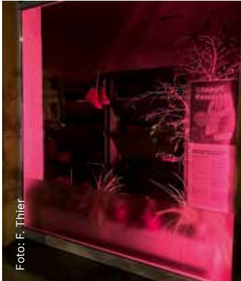
Beleuchtetes Fenster und aufgehängte rote Schuhe – mahndes Symbol gegen Femizide

Am 25. November 2025 war Orange Day – der internationale Aktionstag zur Bekämpfung der Gewalt gegen Frauen und Mädchen. Alle drei Minuten wird eine Frau Opfer häuslicher Gewalt – und diese hat viele hässliche Gesichter in Form von psychischer, körperlicher, sexualisierter oder finanzieller Gewalt. Die extremste