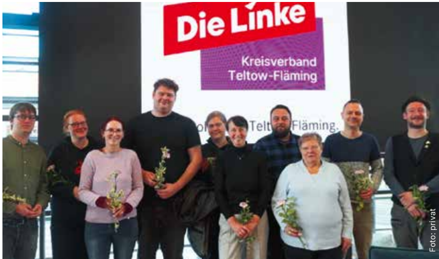
Der neue Kreisvorstand der Linken in Teltow-Fläming

29. Jahrgang · 297. Ausgabe · Dezember 2025/Januar 2026