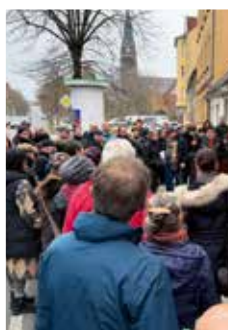
Erinnern in Jüterbog und Luckenwalde