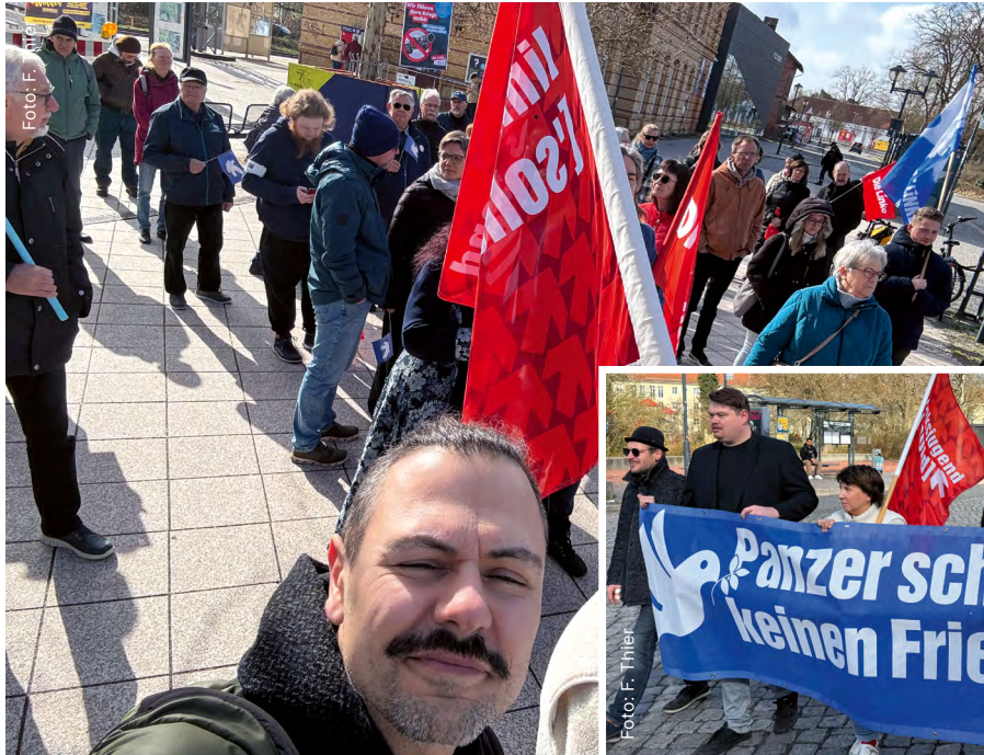
Impressionen vom Ostermarsch in Ludwigsfelde

30. Jahrgang · 299. Ausgabe · April/Mai 2026