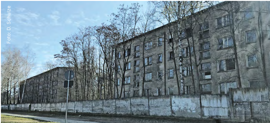
Straßenansicht auf das potentielle Investitionsobjekt im Ortsteil Rehagen

In der Sitzung des Bauausschusses am 5. März habe ich ein Thema auf die Tagesordnung gesetzt, das aus meiner Sicht von großer Bedeutung für die Entwicklung unseres Ortsteils Rehagen ist. Es geht um ein Grundstück mit ehemaligen Plattenbauten in zentraler Lage, das sich in einem vollständig erschlossenen B-Plan-Gebiet befindet und in absehbarer Zeit veräußert werden soll. Verkäufer ist das Land Hessen. Gerade deshalb halte ich es für sinnvoll,