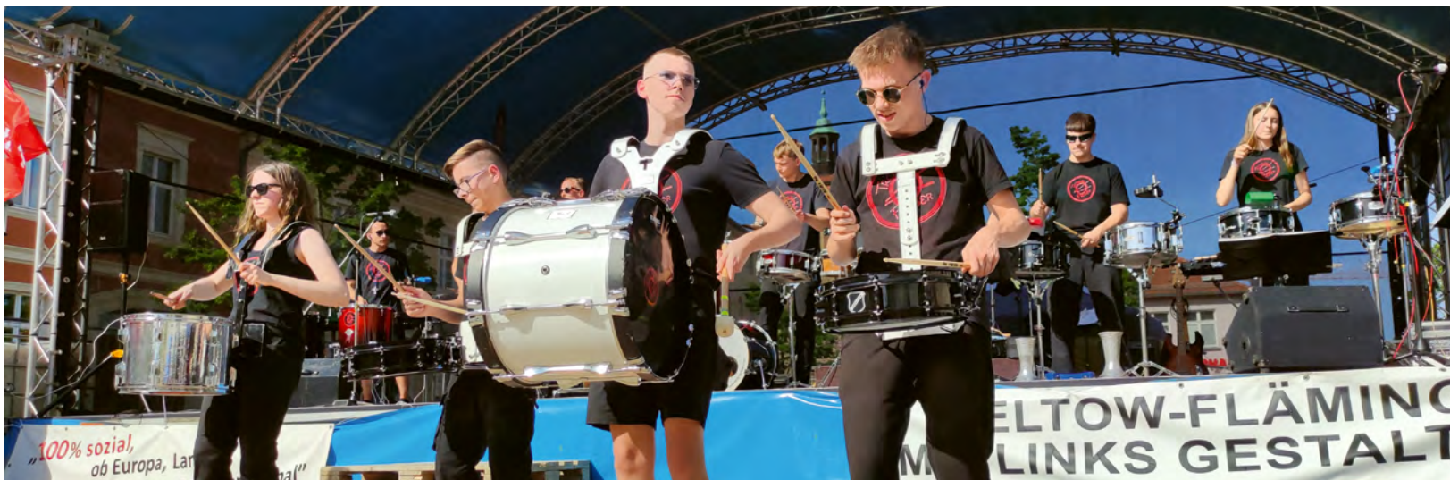
"Trommelfieber" sorgte für Stimmung!