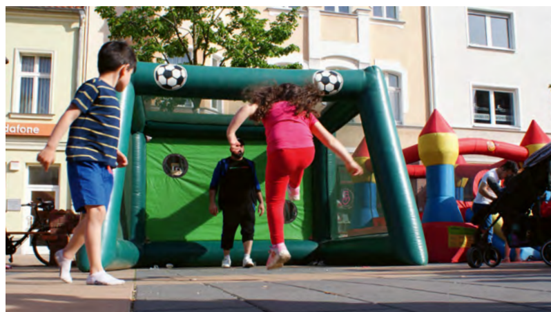
Auch die Jüngsten hatten ihren Spaß!