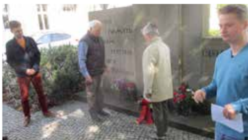
Gedenken in Jüterbog

Wir sagen auch und gerade an diesem 8. Mai: Legt die Waffen nieder! Wir brauchen Frieden!