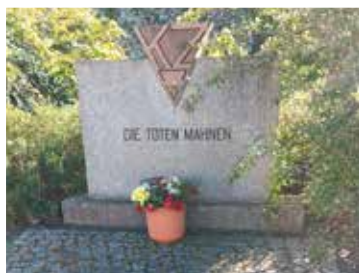
Gedenken in Trebbin