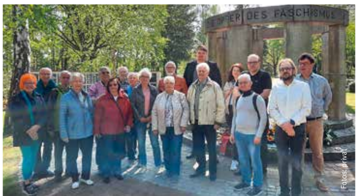
Ehrung in Ludwigsfelde