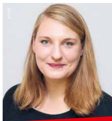
pinaat LANDTAG UND KOMMUNE

All diese Zahlen beziehen sich auf das Jahr 2019. Das heißt, dass die Folgen der Corona-Pandemie noch gar nicht abgebildet sind. Die Bedingungen für Studierende haben sich in dieser Zeit deutlich verschärft. Typische Nebenjobs wie zum Beispiel in der Gastronomie sind weggefallen. Zudem hat eine