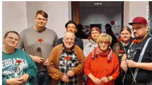
Der neu gewählte Vorstand des Regionalverbandes