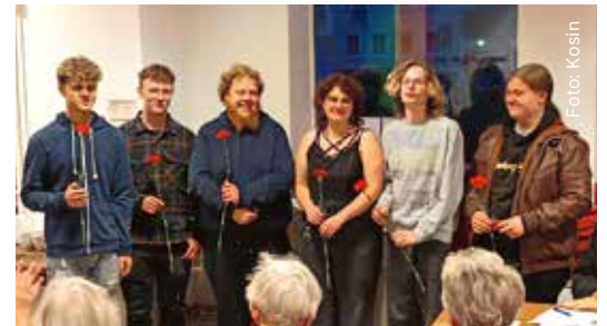
Neue Mitglieder wurden herzlich begrüßt.

Am 10. Oktober kamen die Genoss*innen unseres Regionalverbandes TGL zusammen.