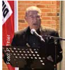
Gregor Gysi bei seiner Rede

Rund 200 interessierte Bürger*innen besuchten am Abend des 20.09. den Wahlkampfabschluss der Linken Teltow-Fläming am Rangsdorfer Rathaus. Bei guter Stimmung, Snacks und Getränken hielten