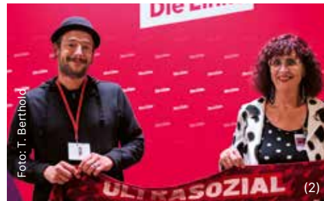
(1) Brandenburger Delegierte beim 9. Bundesparteitag