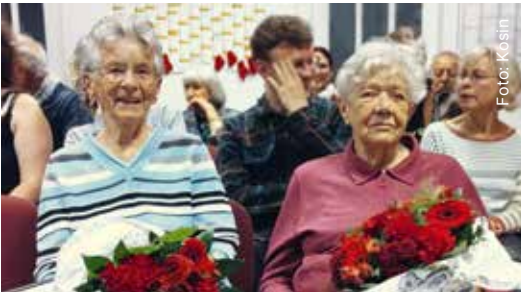
Geehrte langjährige Mitglieder